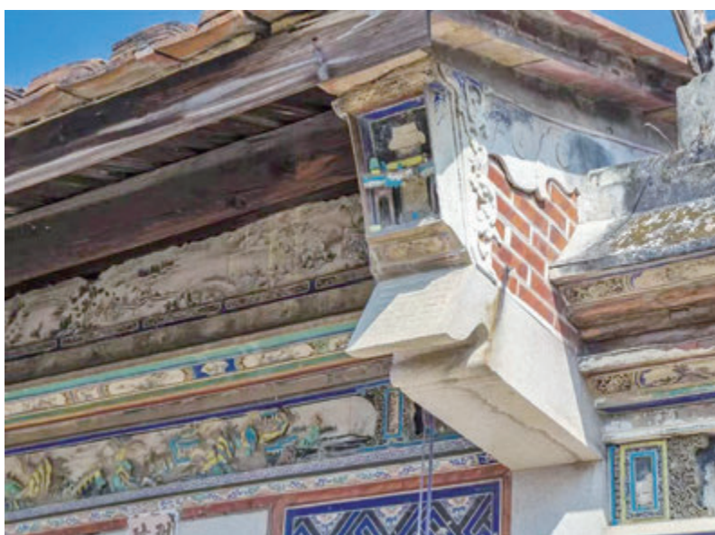
▲在大夫第，隨處可見的木雕、石雕、磚雕，精緻程度無不令人擊節贊嘆。